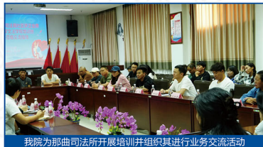
我院为那曲司法所开展培训并组织其进行业务交流活动