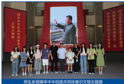
师生参观铸牢中华民族共同体意识文物古籍展