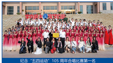
纪念“五四运动”105周年合唱比赛第一名